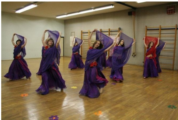
Tečaj orientalskega plesa za študente FF