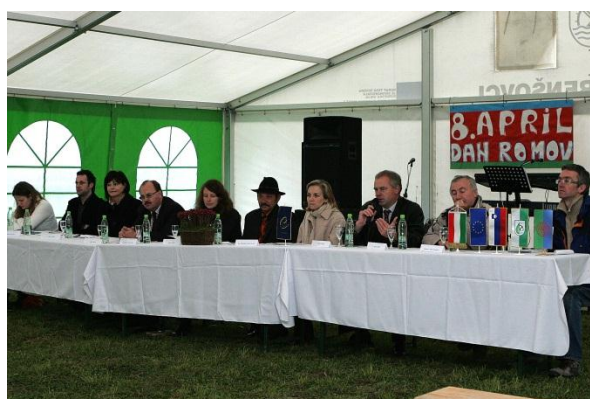
Utrinek iz delavnice o medkulturnem dialogu