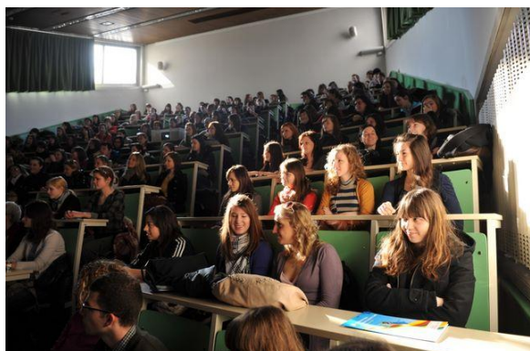
Velika predavalnica v pritličju fakultete

Strokovno podporo dejavnostim fakultete nudijo skupne strokovne službe in tajništva oddelkov.