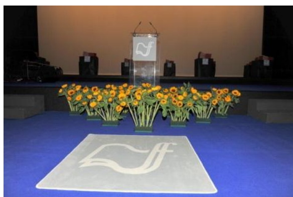
Podelitev diplom v Cankarjevem domu