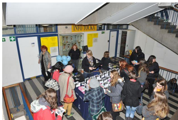
Informativni dan 2011 – predstavitvena stojnica