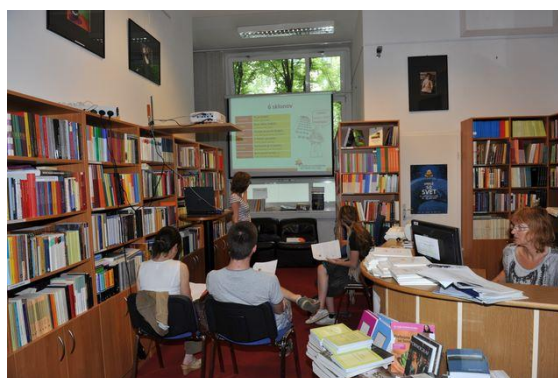
Knjigarna FF