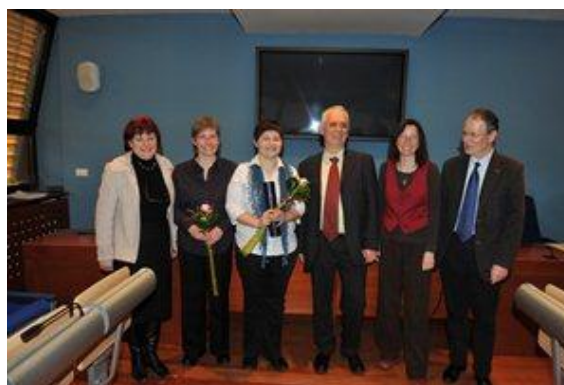
Podelitev Sajetove nagrade v Modri sobi