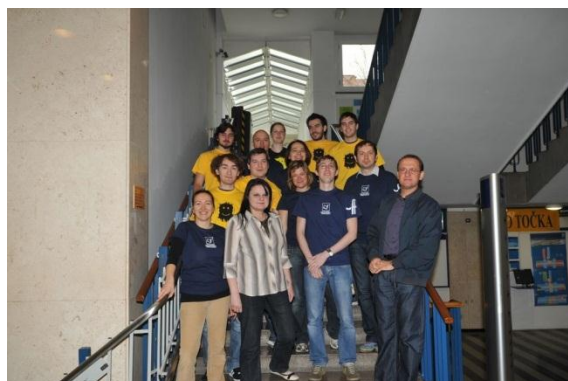
Študentski dnevi 2011 – tek po stopnicah