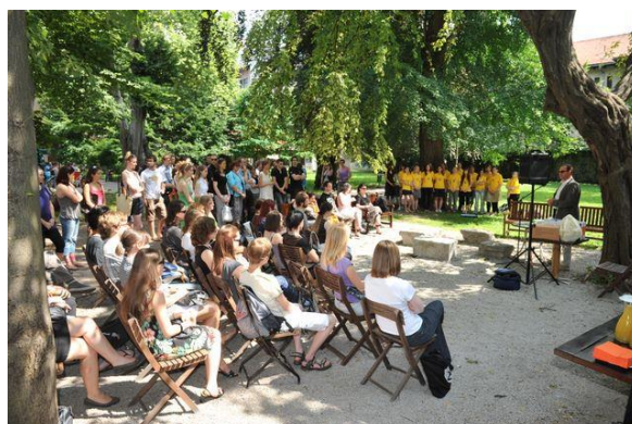
Podelitev nagrad tutorjem na FF