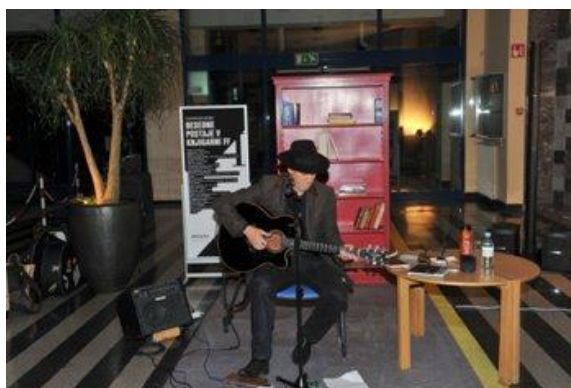
Vlado Kreslin na Besedni postaji v avli FF