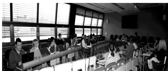
Seja ŠS FF v Modri sobi