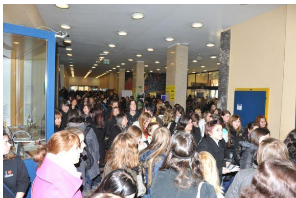
Informativni dan 2011 – dogajanje v avli fakultete