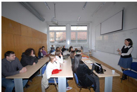
Predavalnica z 20 sedeži v 4. nadstropju