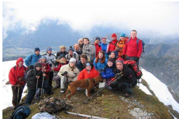
Zimski pohod študentov FF na Dovško babo