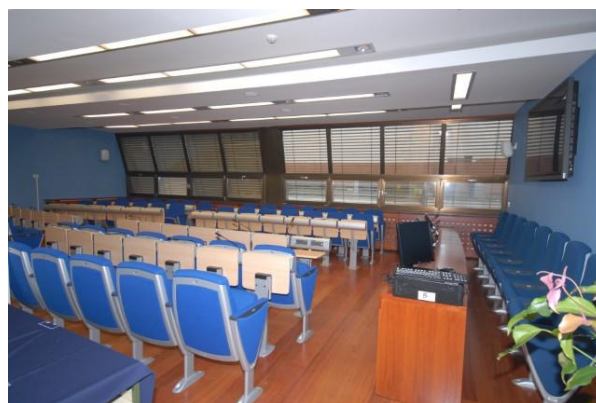
Modra soba v 5. nadstropju