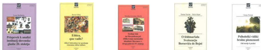
Zbirka razprave ZIFF