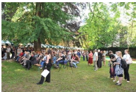
Otvoritev sejma akademske knjige Liber.Ac